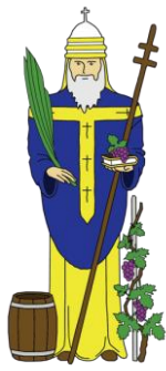
Confrérie Saint Urbain Thionville